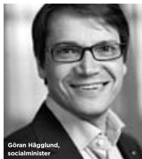
Göran Haggglund, socialminister