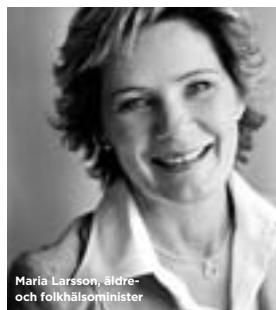
Maria Larsson, äldre- och folkhälsominister